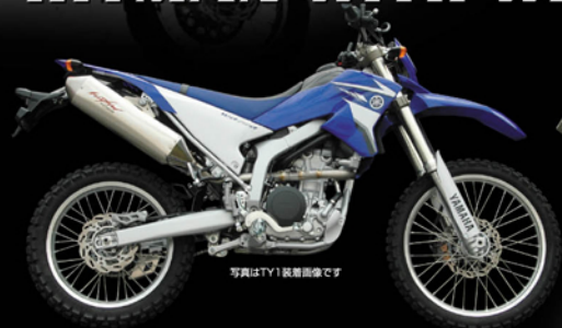
写真はTY1装着画像です