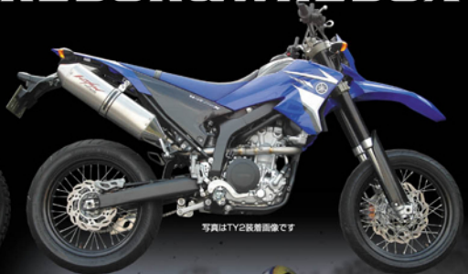
写真はTY2装着画像です